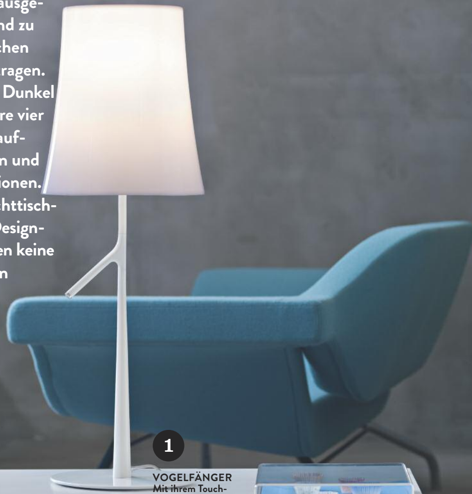
1 VOGELFÄNGER Mit ihrem Touch-Dimmer wirkt die Tischlampe „Birdie“ von Foscarini wie ein perfekter Vogel-Landeplatz. Auch als Standleuchte und in Grau, Orange und Amaranth erhältlich; ab 330 Euro.

BEZUGSADRESSEN AUF SEITE 113; ALLE PREISE SIND ZIRKA-ANGABEN